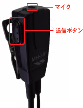
イヤホンマイク使用時